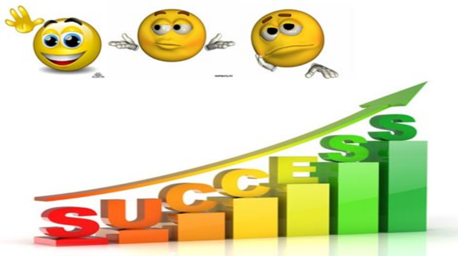
Рисунок 2. - «Лестница успеха» для средних классов

При подведении итога урока, ученикам предлагаю оценить свою работу на уроке. Используя лестницу успеха и смайликов, ученики определяют ступеньку, по «5» балльной шкале оценивания, и объясняют свою оценку. Оценивая свою работу, учащиеся оценивают каждый вид деятельности на уроке, проводят суммарное оценивание, и стараются объективно объяснить свою оценку и выбор ступеньки.