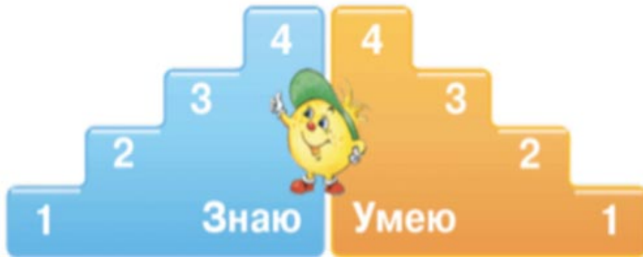
Рисунок 3.- «Лесенка успеха» для начальных классов